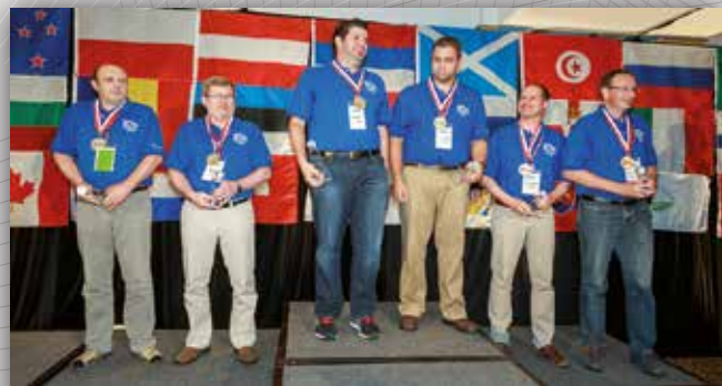
Siegerehrung bei der WRTC 2014 in Boston

Bei der „World Radio Team Championship“ geht es um den weltweit prestigeträchtigsten Contest-Titel auf Kurzwelle. Alle vier Jahre treffen dabei nach einer mehrjähriger Qualifikationsrunde rund 60 Zweiertteams an einem Ort aufeinander, um innerhalb von 24 Stunden den Champion unter sich „auszufunken“.