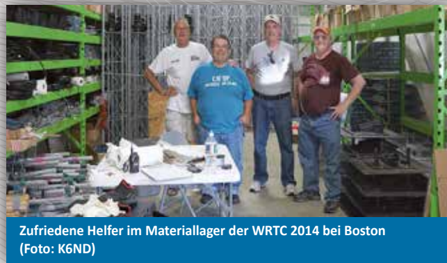
Zufriedene Helfer im Materiallager der WRTC 2014 bei Boston

Wir wollen mit der WRTC 2018 so viel Begeisterung und Interesse wie möglich für den Amateurfunk wecken, so wie es jeder von uns vom Beginn seiner Funkerzeit kennt. Und wir hoffen auf einen „Mini-Sommermärchen-Effekt“, wie ihn Fußballvereine im Jahr 2006 durch die WM im eigenen Land erlebten. Eine WRTC 2018, die viele Ehrenamtliche einbindet, wird dem Amateurfunk in Deutschland gut tun.