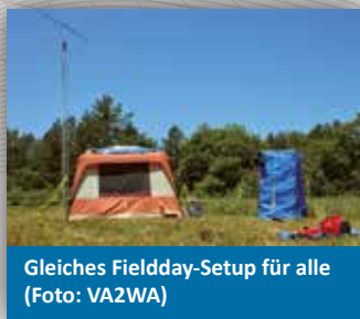
Gleiches Fieldday-Setup für alle

Das Besondere an der WRTC ist, dass alle Teilnehmer mit gleich starken Signalen funken: Sie arbeiten mit 100 Watt und identischen Antennen von gleichwertigen Fieldday-QTHs innerhalb eines geografisch kleinen Radius. Nicht teure Ausrüstung soll den Ausschlag geben, sondern das Können. Gefunkt wird in CW und SSB zeitgleich mit dem weltweiten IARU-Contest am zweiten Juli-Wochenende, der auch wegen seiner Kategorie für HQ-Stationen wie DA0HQ hohe Aktivität garantiert. WRTC-Spitzenteams fahren bis zu fünf Verbindungen pro Minute. Das Siegerteam von 2014, N6MJ und KL9A, kam mit 4572 QSOs in 24 Stunden auf durchschnittlich mehr als drei pro Minute.