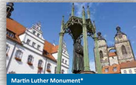
Martin Luther Monument*

2018 vor Ort als Helfer zu unterstützen. Noch stehen viele Vorarbeiten, Tests und Schulungen auf dem Programm, um den besten Contestern der Welt optimale Bedingungen zu bieten – und den mitreisenden Familien, Freunden und Fans freundliche Gastgeber zu sein. Die vielen kulturellen, historischen oder landschaftlichen Ziele in Mitteldeutschland wie Wittenberg, Dresden oder der Wörlitzer Park können dazu beitragen, viele Besucher zur WRTC 2018 zu locken.