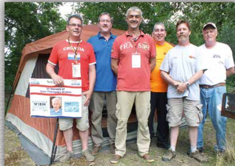
WRTC 2014 - DK6XZ und DK9IP mit Schiedsrichter und Vor-Ort-Helfern